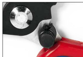
Schwenkbarer Anschlag Swivel stop