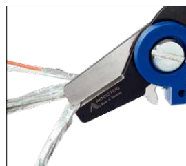
Schneiden der Paarschirmung Cutting the double shielding