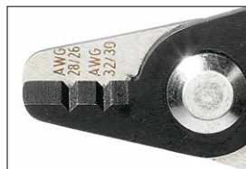
Profilschneide Profile jaws