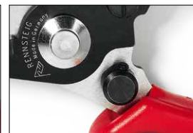
Festanschlag Fixed stop