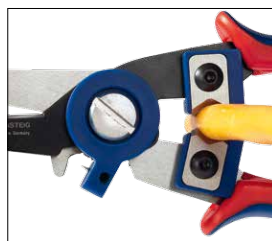
Abmanteln des Außenmantels mittels austauschbarem Formmesser